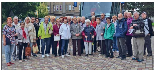
PRVNÍ SKUPINA seniorů těsně před odjezdem od mariánskohorské radnice.