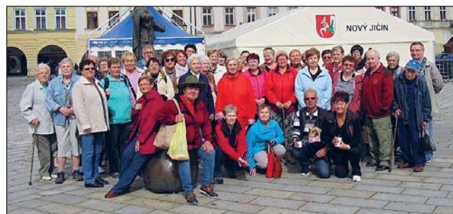
ČTVRTEČNÍ SKUPINA na náměstí v Novém Jičíně.

Po zhruba hodinové prohlídce se všichni přesunuli do Kunína. Nejprve byl na programu oběd v zámeckém prostředí, pak se všichni po výborném obědě ve dvou etapách vydali na prohlídku samotného zámku, který je známý nejen krásnými interiéry, ale také bohatou historií. Celá akce byla zakončena kolem půl čtvrté odpoledne návratem k radnici. „Zvolili jsme termíny hned na začátku září, a to úterý 5. a čtvrtek